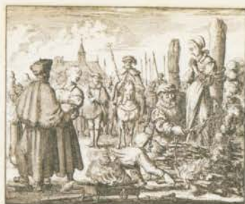
Doet van Bary van Borken in 1644 te Delden.