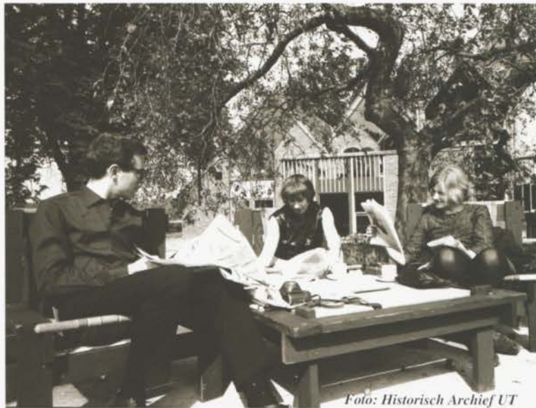
Spontane ontmoeting en studie voor de boerderij

ontwerp te maken voor het nieuwe campusterrein van de UT te Drienerlo als een aantrekkelijk en karakteristiek geheel. Kortom, maak een mooie UT. Het idee was een campusterrein te ontwerpen, weg van de stad, zodat onderwijs, wetenschap en wonen elkaar konden versterken in een inspirerende omgeving. Door dit architectenbureau werd de jonge architect Piet Blom benaderd om een ontwerp te maken voor de verbouwing van een Twentse boerderij op het terrein tot mensa. Blom greep die kans aan. De opdracht voor de verbouwing van de boerderij bracht Piet Blom landelijke bekendheid. De bestaande boerderij liet hij afbreken en hij bouwde er een nieuwe. Blom maakte gebruik van de