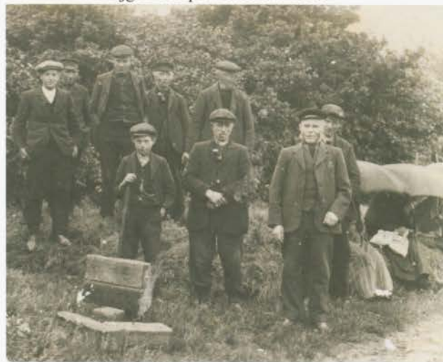
Gereed voor het uitdelen. De vrouwen zitten onder hun paraplu's te wachten op het uitdelen.