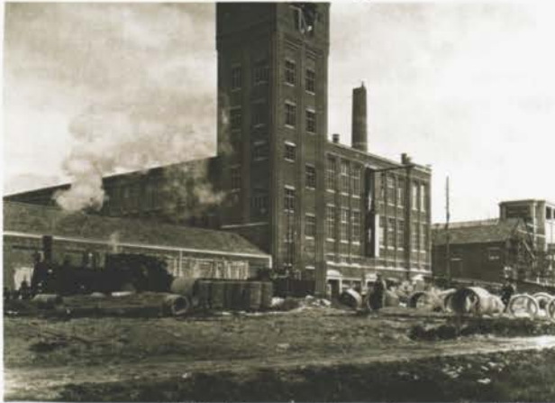
De Losserse textielabriek van de firma L. van Heek & Zn. in aanbouw, eind jaren '20.

zich tegenover haar leden op het succes liet voorstaan. En vervolgens wilde zij de verbetering ook doorgevoerd zien bij de textielbedrijven die niet bij de fabrikantenverenigingen waren aangesloten. Als proefvijver voor een arbeidsconflict kwam Losser helemaal in aanmerking.