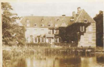
Akkerhuys van Mees Twickel.