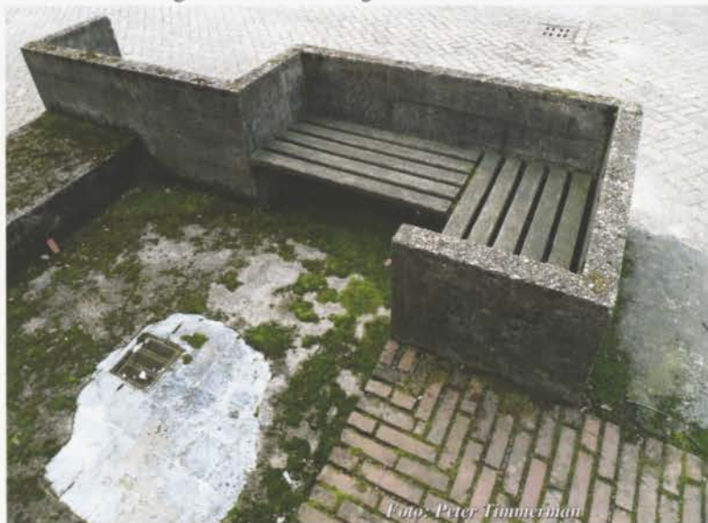
Betonnen zitbankje van Piet Blom

Blom. De boerderij heeft een compleet ander interieur gekregen. Hij doet nu dienst als een mooi restaurant, de Faculty Club. Dus worden daar heel andere eisen aan gesteld dan aan een Mensa. Ook de Bastille onderging een enorme verbouwing. Van de vele hoekjes en nissen in het interieur is nog weinig over. Ook de door Piet Blom ontworpen stoelen zijn verdwenen. Ze staan waarschijnlijk her en der nog bij mensen thuis. Slechts één object herinnert nog aan de door Piet Blom ontworpen meubels. Dat is de bank bij de Boerderij. Het was de bedoeling dat deze werd gebruikt als spontane ontmoetingsplaats. Er werd zelfs een kampvuurplaats aangelegd om deze ontmoeting gezellig en inspirerend te kunnen maken. De bankjes liggen er nu verlaten bij. De zitplaats is te donker op het noorden om gezellig te zijn, ondanks de mogelijkheid voor een gezellig haardvuur. De houten en betonnen banken bleken te hard voor een comfortabele ontmoeting. Ik vrees dat ze gesloopt zullen worden wegens gebrek aan interesse. Voor de fietsenstalling die er pal naast staat, is het een obstakel. Ik vrees dat deze bank bij het volgende lustrum voorgoed historie is.