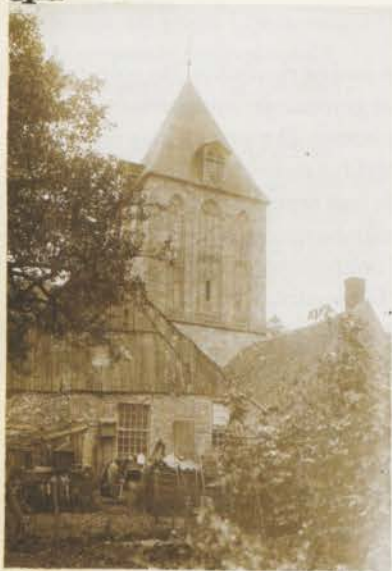
Toren en Ackerhuus te Delden.