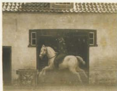
Toren v. d. Stalling bij den Bross van Twinkte te Delden.