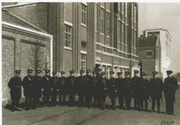
Rijksveldwacht op volle sterkte tijdens de staking.

De staking werd uiteindelijk door de vakorganisaties beëindigd. Toen zij zagen dat het conflict niet langer volgens hun spelregels verliep en op straat dreigde te worden uitgevochten, achtten zij de tijd voor een akkoord gekomen. Een hint in die richting werd door de rijksbemiddelaar opgepakt, waarna voor dinsdag 8 maart een nieuwe conferentie met de werkgever werd belegd. Al snel werd men het daarna aan de onderhandelingstafel eens over een pakket van arbeidsvoorwaarden, dat eigenlijk niet veel verschilde van wat de directie zelf al had aangeboden om een staking te voorkomen. Voor de drossers en afzetters in de spinzaal was er nu zelfs 5% minder verhoging. Eigenlijk hadden de arbeiders voor dit resultaat dus niet hoeven te gaan staken. Maar de vakbonden zetten de